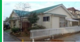
上五十嵐保育園 徒歩6分(450m)

◇ 所在地 新潟市西区五十嵐二の町8359番104 ◇ 地目 宅地 ◇ 都市計画 市街化区域 ◇ 用途地域 第一種低層住居専用地域 ◇ 取引態様 売主 ◇ 引渡し時期 即時 ※開発道路は区画1～8の共有持分となります。 ◇ 建ぺい率 50% ◇ 容積率 100% ◇ 設備 上水道・都市ガス敷地内引込済 下水道未整備地域の為、買主様にて個別合併浄化槽の 設置が必要となります。 ◇ 学校区 内野小学校、内野中学校 ◇ 交通 JR越後線「内野駅」まで徒歩10分 2022/11/14