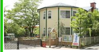
旭が丘幼稚園 徒歩3分(250m)