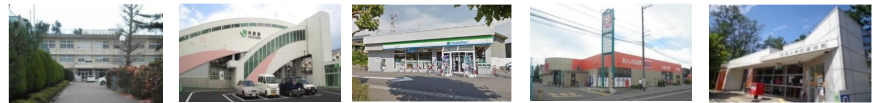
内野中学校 徒歩17分(1.3km) JR越後線 内野駅 徒歩10分(800m) ファミリーマート 徒歩5分(400m) 清水フードセンター大学前店 車7分(2.6km) 新潟大学前郵便局 徒歩12分(950m)