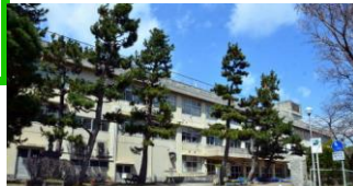
内野小学校 徒歩10分(800m)