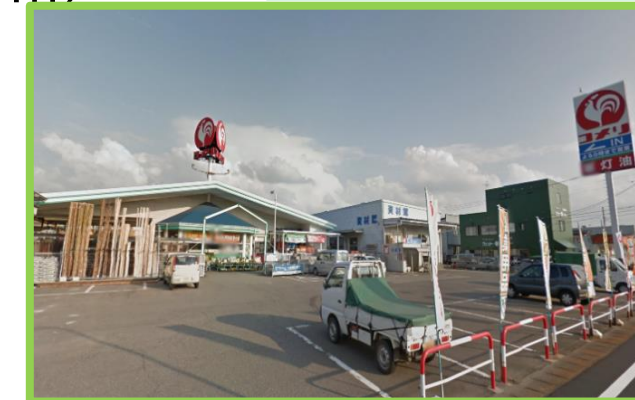
コメリ与板店 徒歩5分(400m)