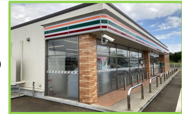
セブンイレブン並柳店 徒歩4分(300m)