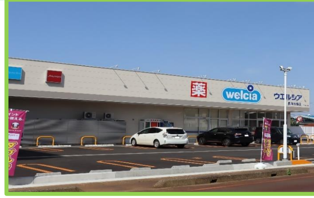
ウェルシア与板店 徒歩6分(450m)