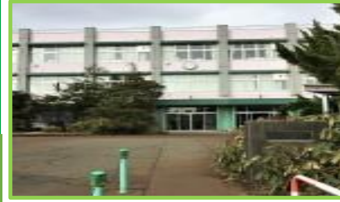
与板小学校 徒歩9分(700m)

②長岡北インターまで車で7分 古正寺まで車で10分の好立地 ③与板小・中学校が 徒歩10分以内で通学も安心 ④急な体調不良でも安心な 内科医院、歯科医院が徒歩5分 ⑤広々敷地で恐竜公園すぐそば 子育てしやすい住環境