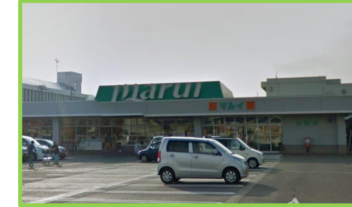
スーパーマルイ与板店 徒歩5分(400m)