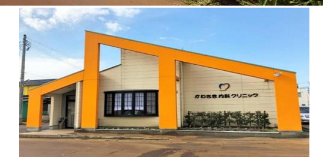
かわさき内科350m (徒歩5分)