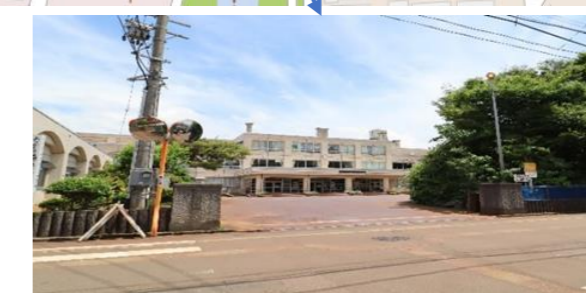
長岡市立川崎小学校300m (徒歩4分)