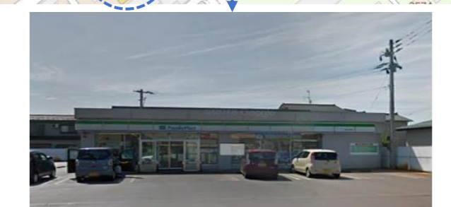
ファミリーマート長岡川崎店190m (徒歩3分)