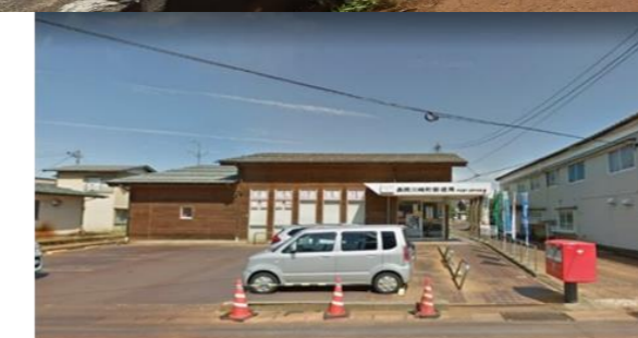
長岡市川崎町郵便局270m (徒歩4分)