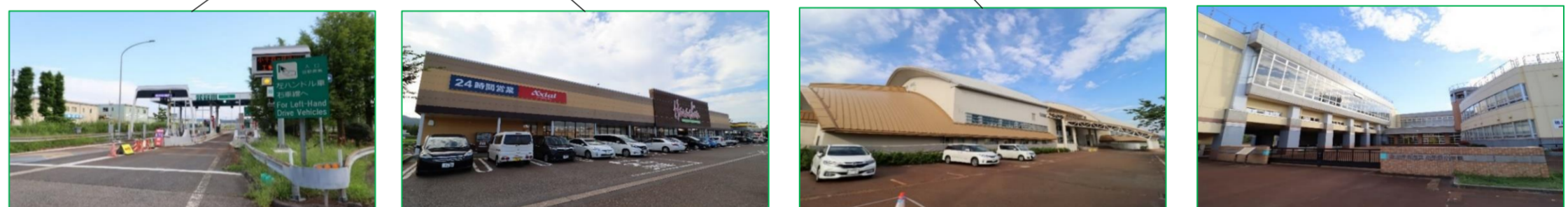
小千谷インター 車で1分(約500m) | 原信 桜町店 車で2分(約800m) | 小千谷市総合体育館 徒歩5分(約400m) | 小千谷小学校 徒歩16分(約1,280m)