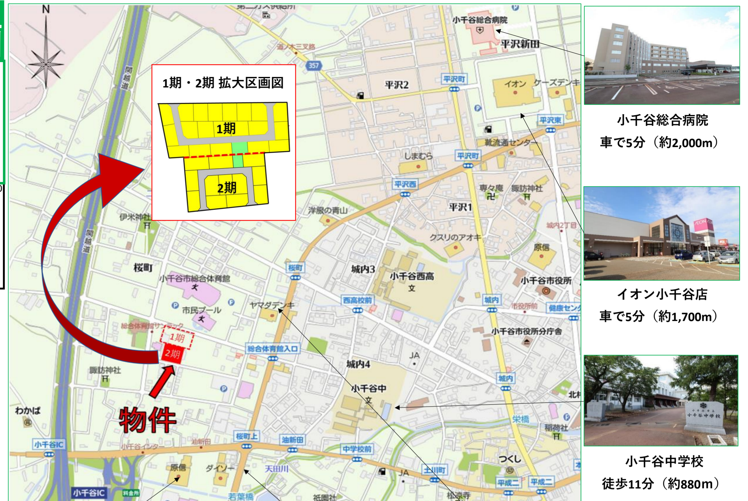
小千谷総合病院 車で5分(約2,000m)