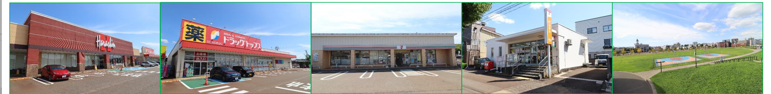
原信 シビックコア店 車で3分(約850m) | ドラックトップス千歳店 車で3分(約850m) | セブンイレブン市立劇場前 徒歩2分(約120m) | 三和郵便局 徒歩2分(約140m) | 長岡市民防災公園 車で4分(約1,200m)