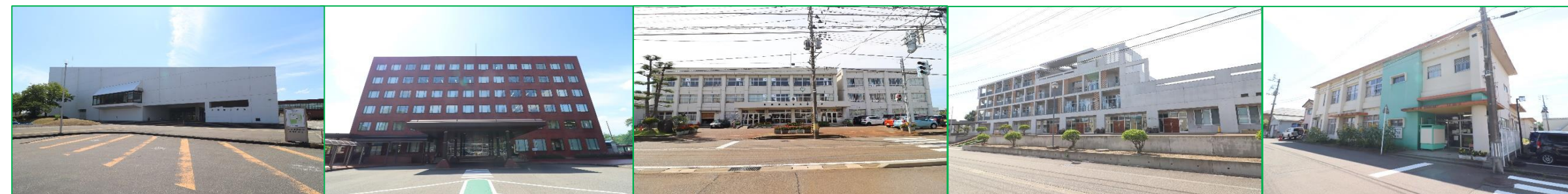
長岡市立劇場 徒歩2分(約160m) | さいわいプラザ 徒歩2分(約160m) | 宮内小学校 徒歩18分(約1,400m) | 宮内中学校 徒歩20分(約1,600m) | 三和保育園 徒歩4分(約270m)