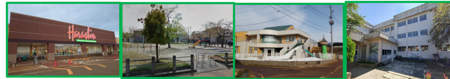
原信 長岡花園店 徒歩8分(約650m) | 花園東公園 徒歩5分(約400m) | 悠みどりこども園 徒歩6分(約450m) | 四郎丸小学校 徒歩15分(約1,200m)