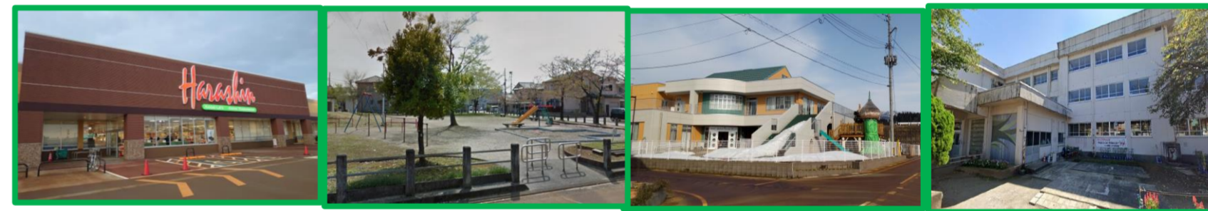
原信 長岡花園店 徒歩8分(約650m) 花園東公園 徒歩5分(約400m) 悠みどりこども園 徒歩6分(約450m) 四郎丸小学校 徒歩15分(約1,200m)