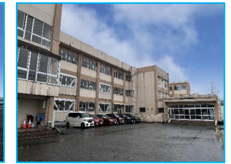
長岡市立栖吉中学校 徒歩19分(約1,500m)