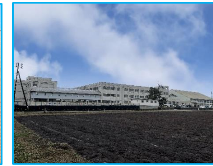
長岡市立栖吉小学校 徒歩19分(約1,500m)