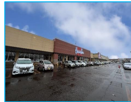
原信 美沢店 徒歩8分(約600m)