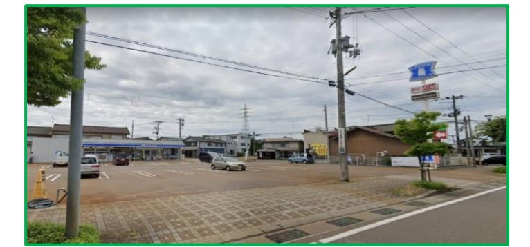
ローソン見附学校町店 徒歩5分(350m)