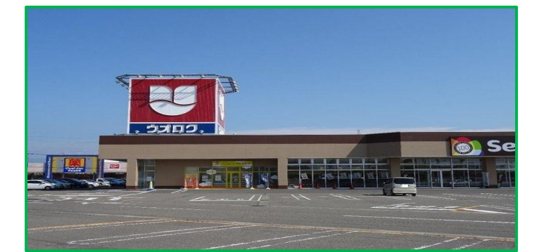
ウオロク見附店 車で3分(850m)