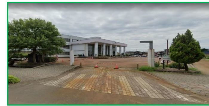
見附小学校 徒歩7分(550m)