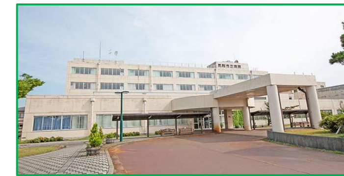
見附市立病院 徒歩7分(550m)