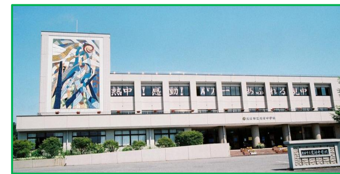
見附中学校 徒歩22分(1,700m)