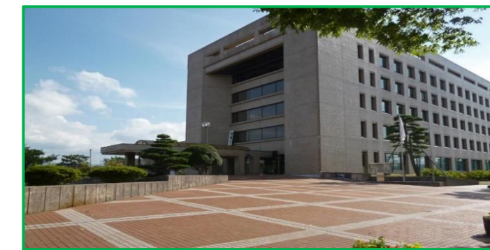
見附市役所 徒歩4分(260m)