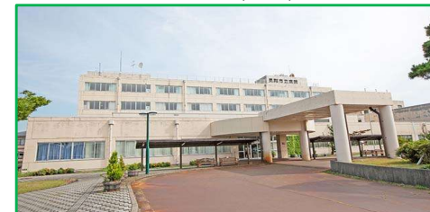
見附市立病院 徒歩7分(550m)