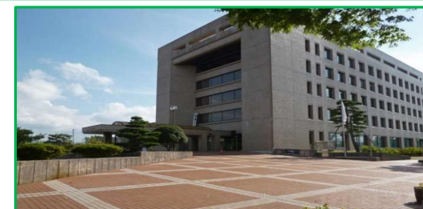
見附市役所 徒歩4分(260m)