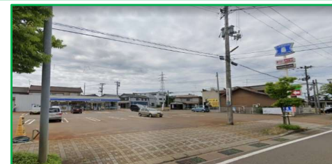
ローソン見附学校町店 徒歩5分(350m)