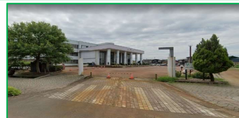
見附小学校 徒歩7分(550m)