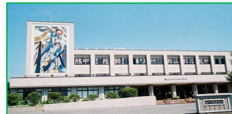
見附中学校 徒歩22分(1,700m)