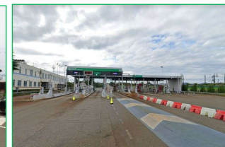
長岡インター 車で5分 (約1800m)