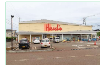
原信 関原店 徒歩5分 (約350m)