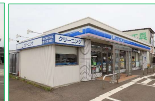
ローソン 関原店 徒歩5分 (約400m)