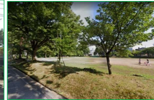
関原公園 徒歩7分 (約500m)