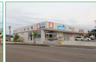
ウエルシア 関原店 徒歩5分 (約400m)