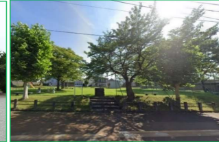
中原公園 徒歩5分 (約350m)