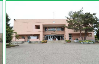
関原中学校 徒歩5分 (約350m)