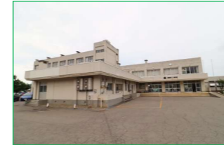
関原小学校 徒歩7分 (約550m)