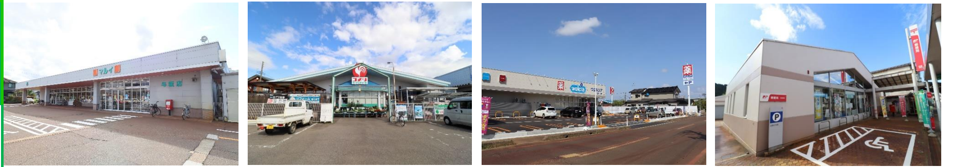
スーパーマルイ与板店 徒歩7分(約550m)