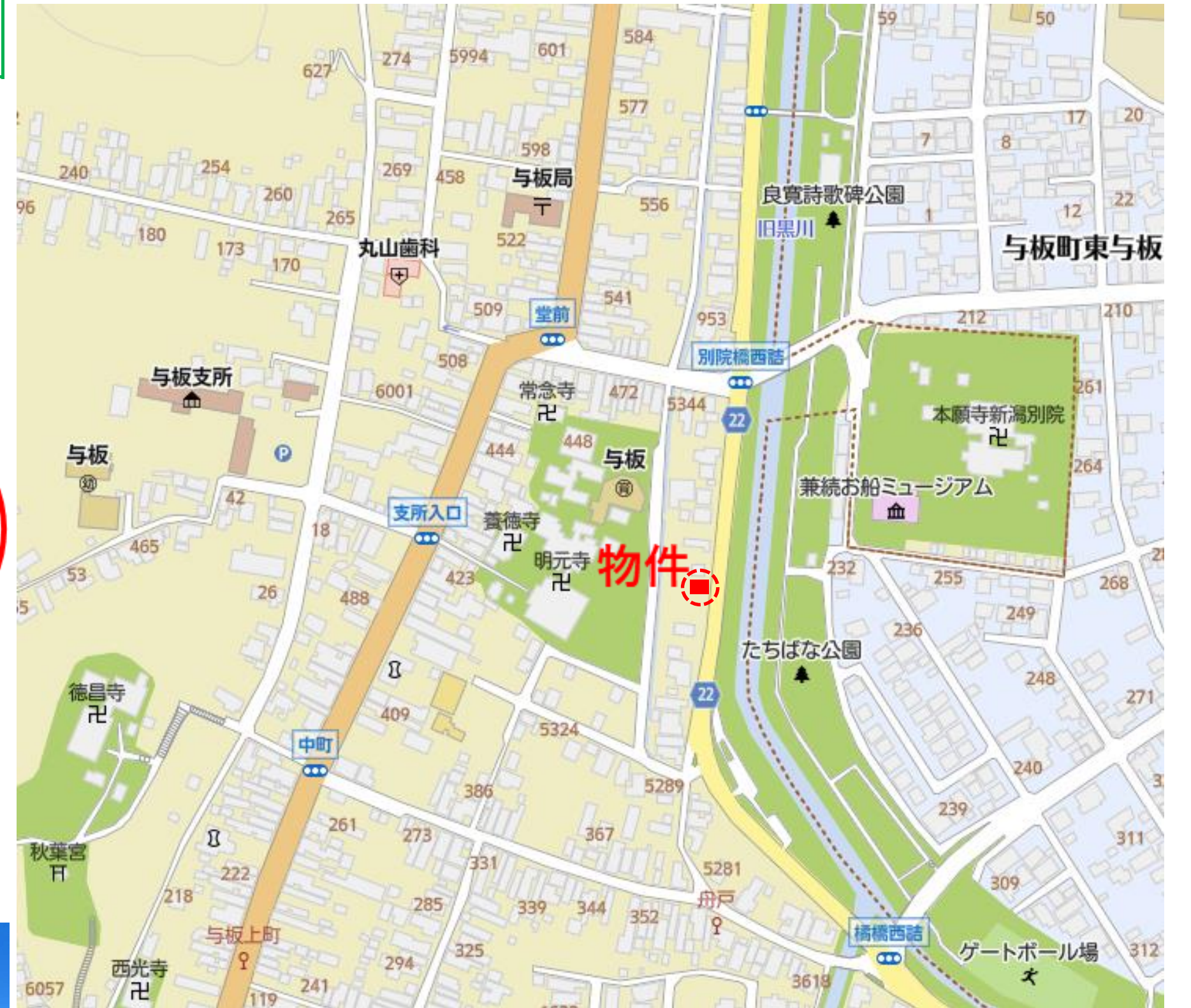
与板町郵便局 徒歩4分(約300m)