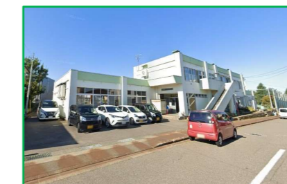
中貫保育園 車で2分(120m)