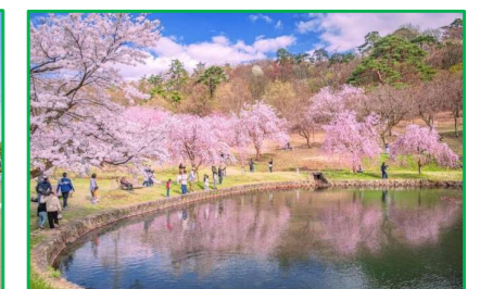
悠久山公園 徒歩9分(700m)