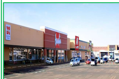
アクロスプラザ 長岡店 車で5分(2,200m)