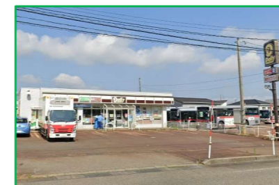
デイリーヤマザキコンビニ 徒歩で10分(850m)