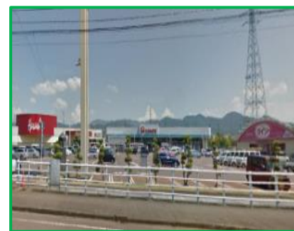
宮内ショッピングセンター 1.5km