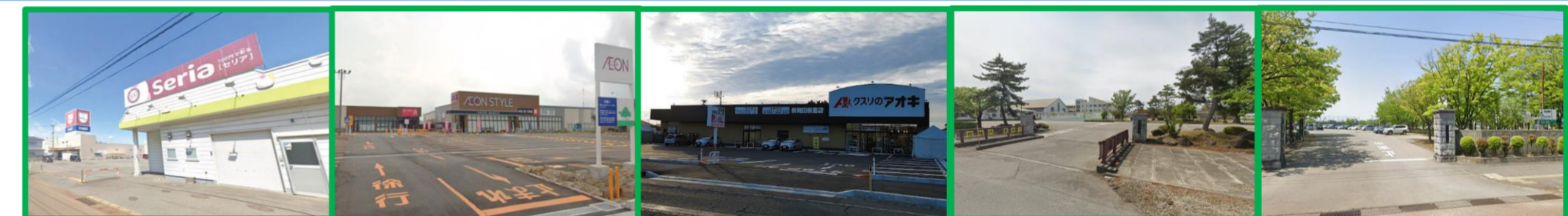
ウオロク セリア 徒歩6分(約450m) | イオンスタイル ダイソー 徒歩5分(約350m) | クスリのアオキ 徒歩5分(約400m) | 二葉小学校 徒歩9分(約650m) | 本丸中学校 徒歩7分(約500m)