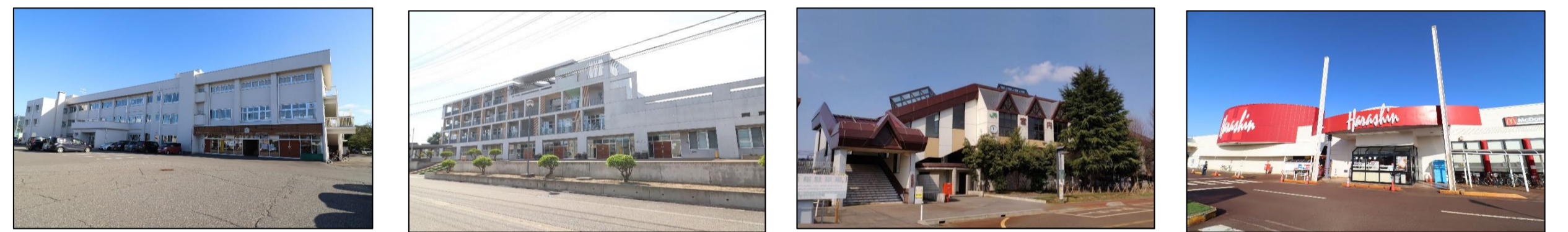
上組小学校 徒歩15分(約1,200m) | 宮内中学校 徒歩20分(約1,600m) | 宮内駅 徒歩10分(約800m) | 原信 宮内店 車で3分(約1,000m)